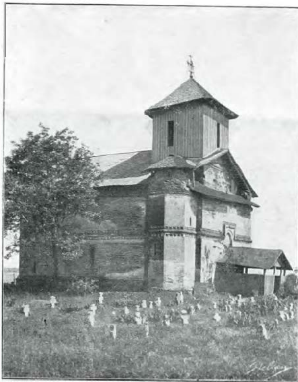
Biserica din Popești-Vlașca: vedere spre nord-vest.