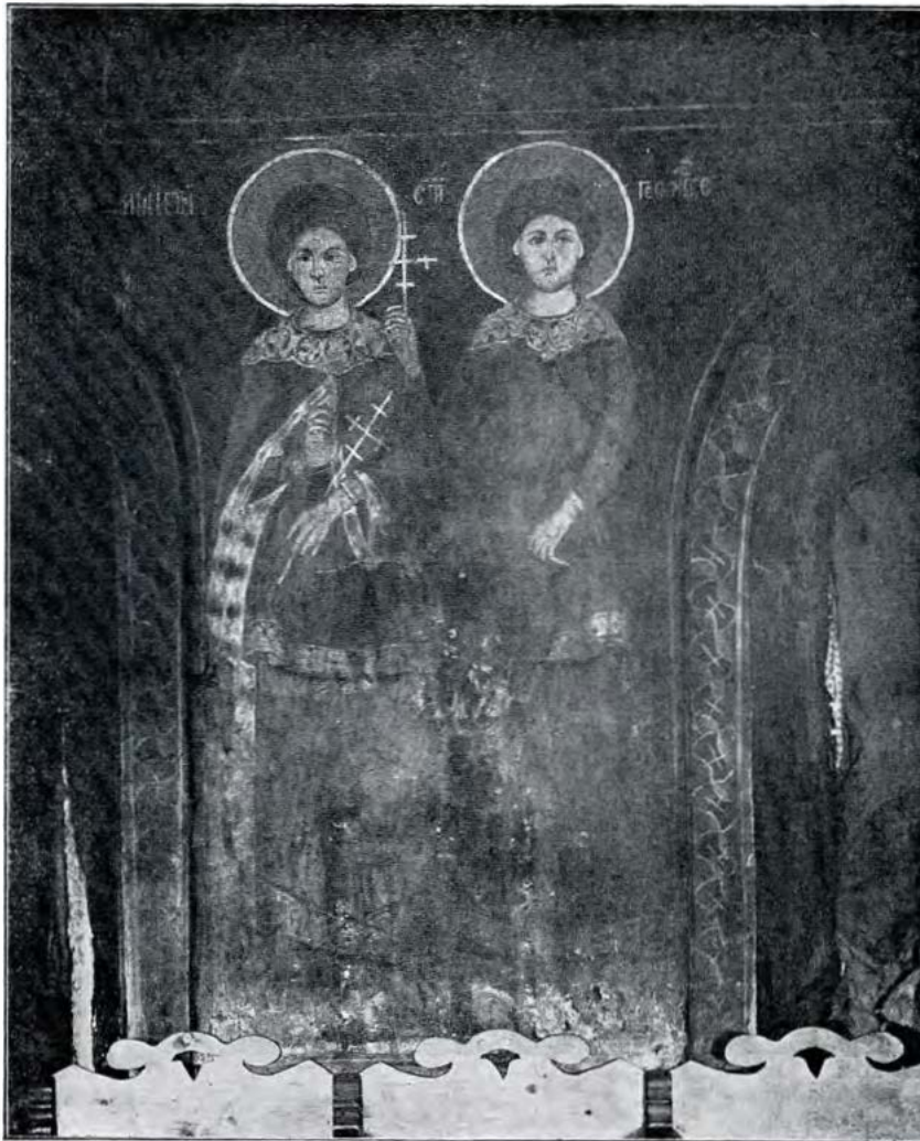
Picturi vechi (1869) în naia bisericii din Popești-Viașca.